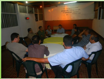
Reunión de trabajo en Nicaragua